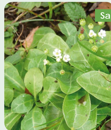
Samole de Valérand