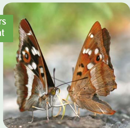
Grand mars changeant