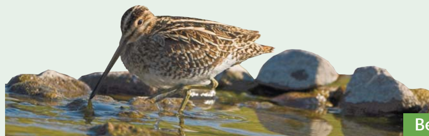
Bécassine des marais

Les plantes présentes sur le marais sont aussi adaptées aux sols très humides et pauvres en éléments nutritifs. Elles sont devenues rares avec la disparition de leur habitat.