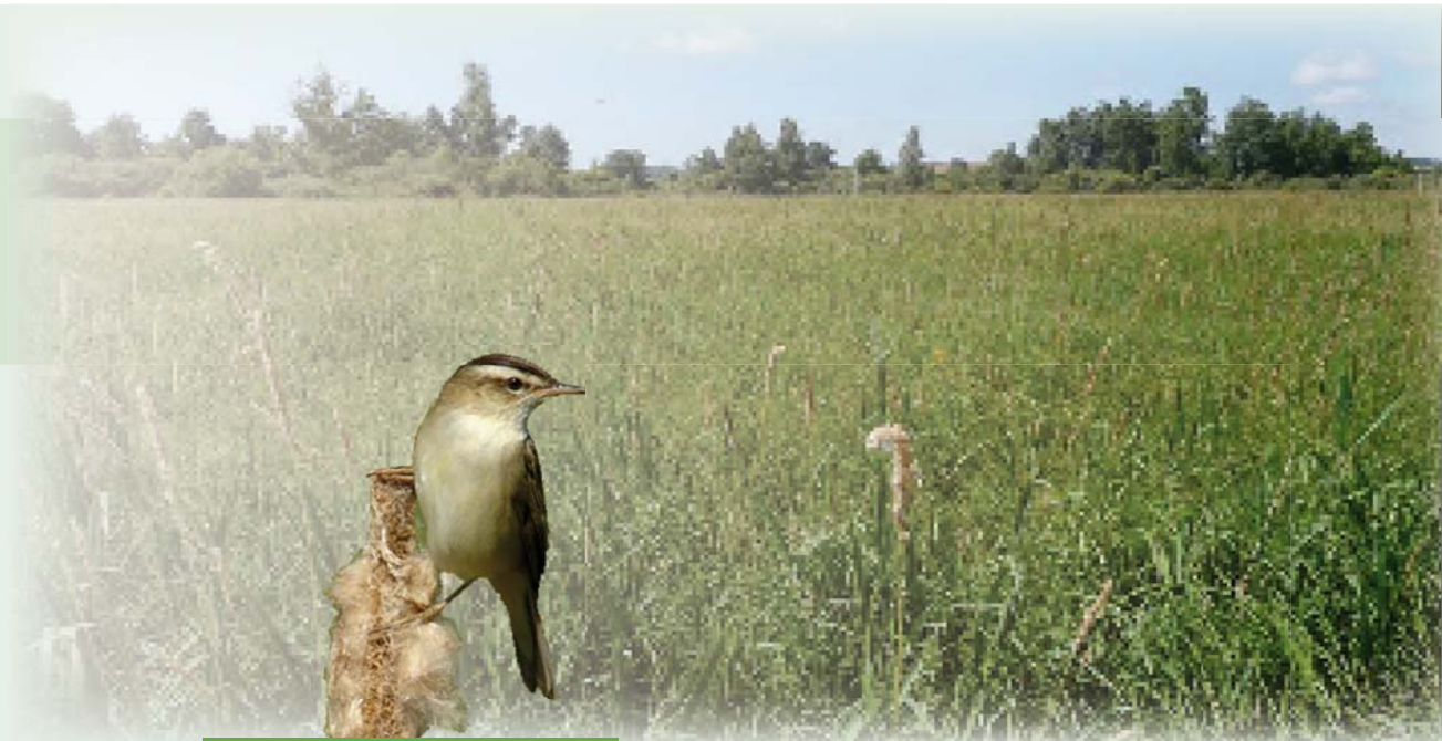
Phragmite des joncs

Le petit marais de Oyes, zone humide d'une superficie de 12 hectares, s'inscrit dans le vaste ensemble des marais de Saint-Gond (près de 1700 hectares). Cet espace naturel est la plus importante et l'une des dernières tourbières alcalines de la région.