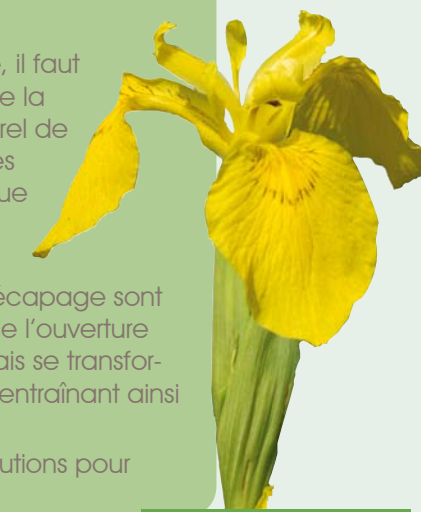
Iris des marais

Enfin, le pâturage reste l'une des meilleures solutions pour entretenir les prairies humides.